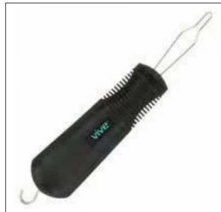
GANCHO PARA BOTONES