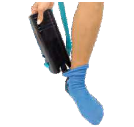
APARATO PARA PONER Y QUITAR MEDIAS