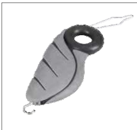
GANCHO PARA BOTONES (CON ORIFICIO PARA EL DEDO)