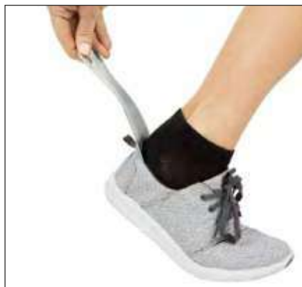
CALZADOR DE METAL DE 7,5"