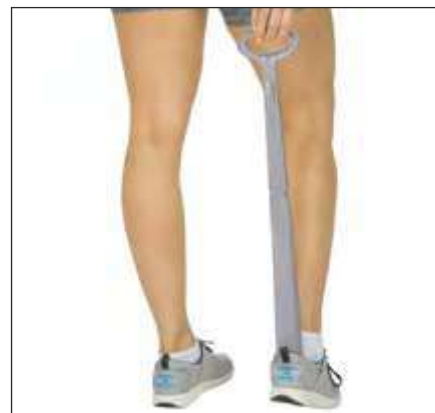
CALZADOR DE 23" CON QUITACALCETINES