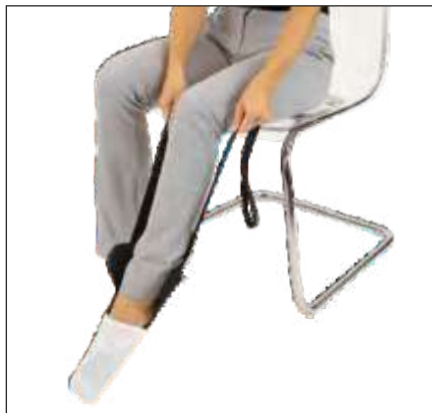
DISPOSITIVO FLEXIBLE PARA PONER MEDIAS