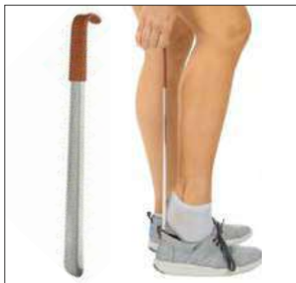
CALZADOR DE METAL DE 16,5"