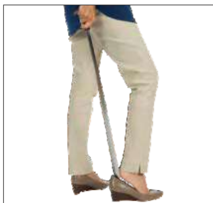
CALZADOR DE METAL DE 31,5"