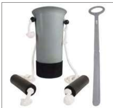
KIT DE ASISTENCIA PARA MEDIAS Y CALZADO