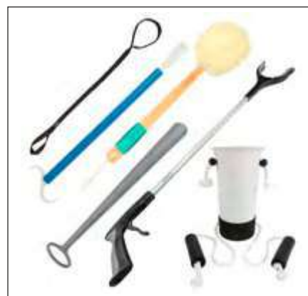
KIT DE RECUPERACIÓN DE CÁDERA Y RODILLA