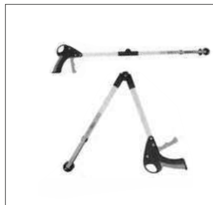
ALCANZADOR PLEGABLE CON VENTOSA