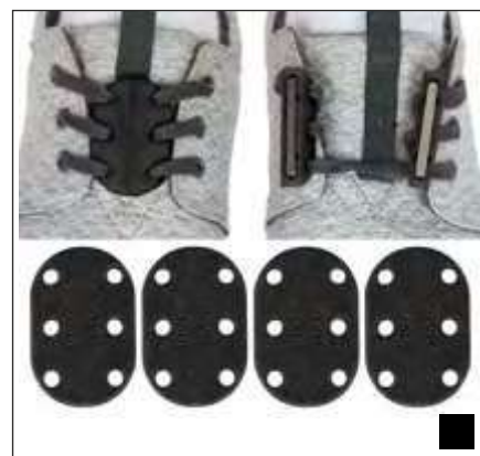
CIERRES DE CALZADO MAGNÉTICOS