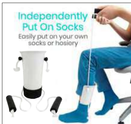
DISPOSITIVO PARA PONER MEDIAS