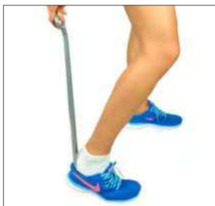
CALZADOR DE 24"