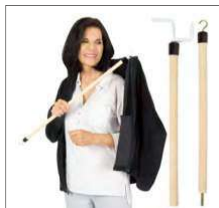
BASTÓN DE VIAJE PARA VESTIRSE