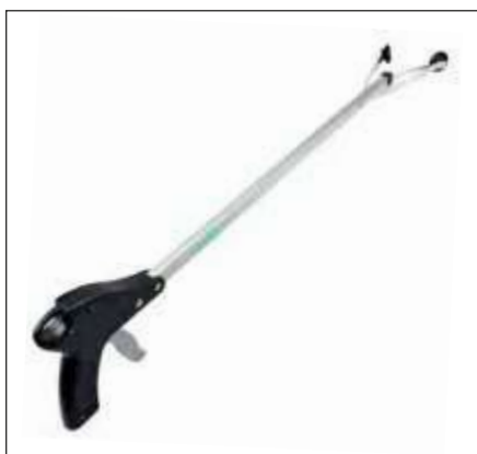
ALCANZADOR DE OBJETOS CON VENTOSA